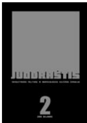
Juodraščių Nr. 2, 2009 balandis